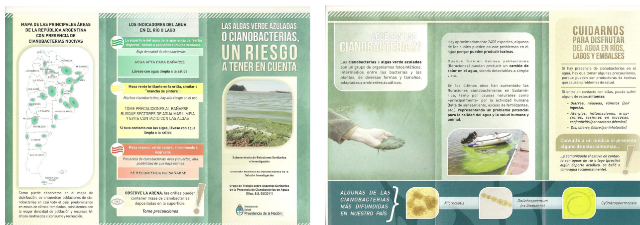
Fig N°1: Folleto “Las algas verde azuladas o cianobacterias, un riesgo a tener en cuenta”.

Se elaboró una encuesta de evaluación del folleto, a fin de acompañar con una entrega selectiva del mismo, siendo los resultados de la encuesta muy positivos hasta el presente.