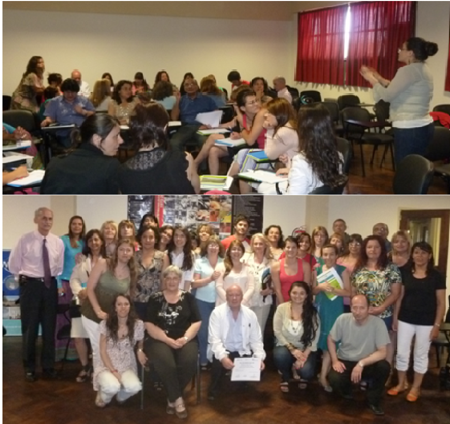
Fotos N°1 y 2: Talleres durante el II Encuentro, Córdoba 2012.

Se desarrollaron talleres de comunicación social con participación de expositores especializados en esta temática y en educación para la salud pertenecientes al Ministerio de Salud de la Nación. Al final se realizó un taller de elaboración de un proyecto de comunicación y prevención a nivel local desde los CAPS.